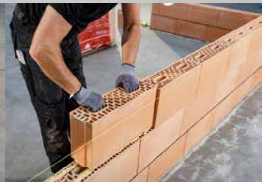
17. De stenen plaatsen