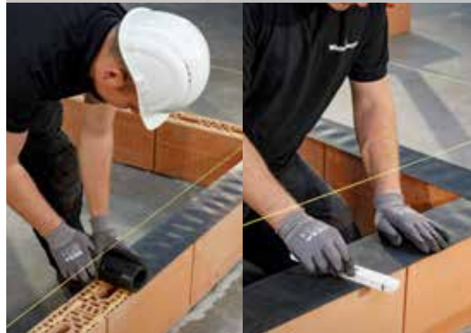
11. De waterkering plaatsen en goed vlak aandrukken op de aangebrachte Dryfix extra