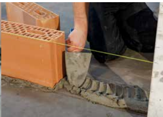
4. De eerste laag (kimlaag) uitmetselen met traditionele mortel