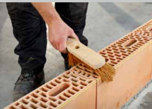
8. De stenen afborstelen (te herhalen bij het aanbrengen van elke laag)