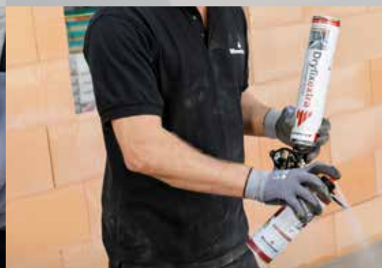
5. Bij korte pauzes de spuitmond reinigen met Dryfix cleaner