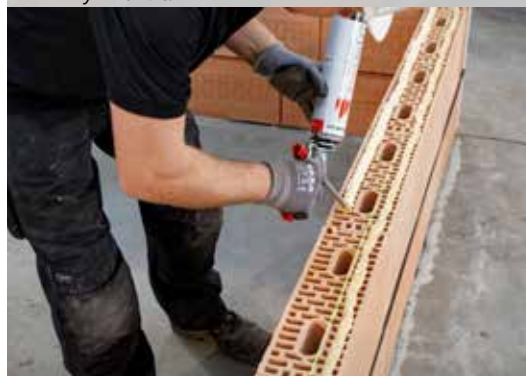
16. Dryfix extra aanbrengen in 2 stroken van 3 cm breed en op \pm 1 cm van de buitenzijde van de steen