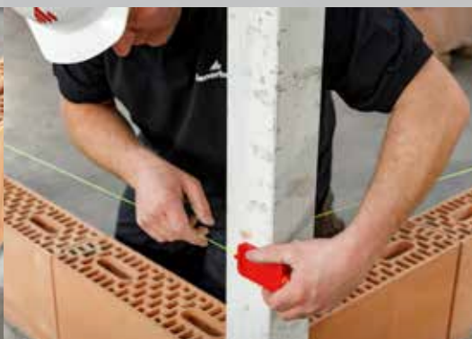
9. De metselkoord aanbrengen op hoogte \pm 2 cm onder de hoogte van de tweede laag