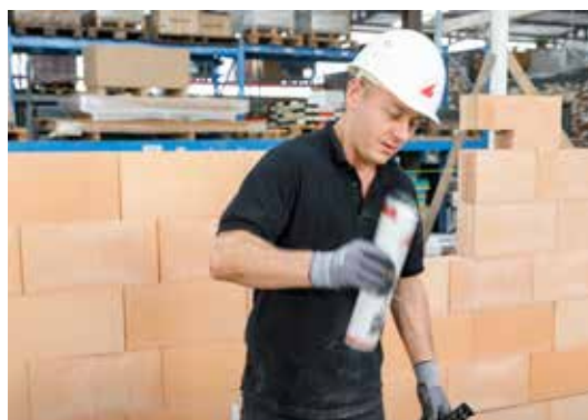
1. De bus Dryfix extra 20x goed schudden