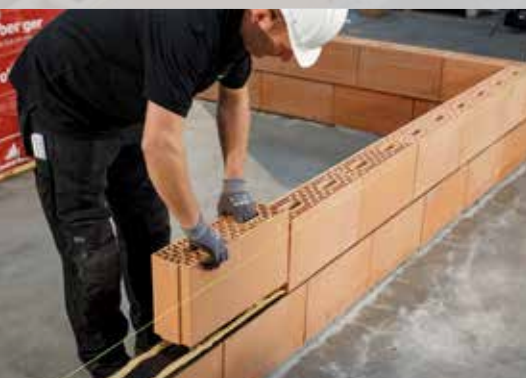
13. De tweede rij stenen plaatsen