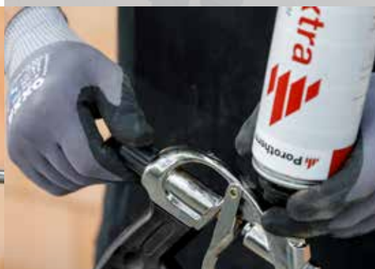
4. Het debiet regelen met de regelschroef