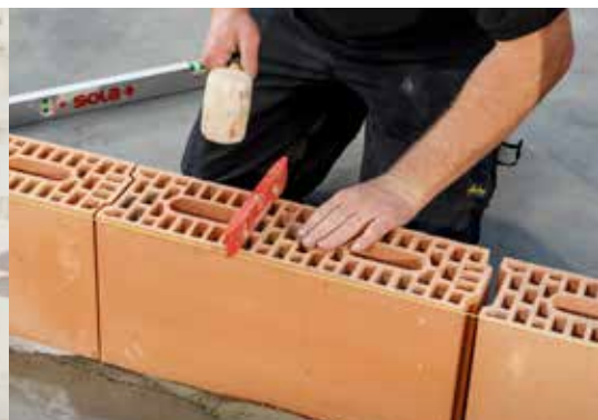
5. De vlakheid dwars op de muur controleren