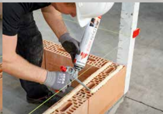
10. Dryfix extra aanbrengen in 2 stroken van 3 cm breed en op \pm 1 cm van de buitenzijde van de steen