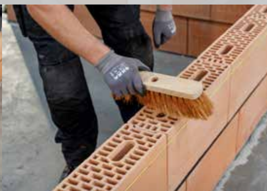
14. De stenen afborstelen