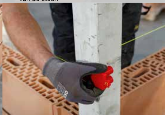
15. De metselkoord aanbrengen op \pm 2 cm onder de hoogte van de volgende laag