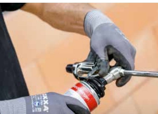
3. De bus Dryfix extra op de gereinigde spuitmond schroeven en lichtjes aandraaien