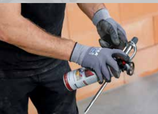
6. Bij langere pauzes de bus Dryfix extra verwijderen en de spuitmond reinigen met Dryfix cleaner