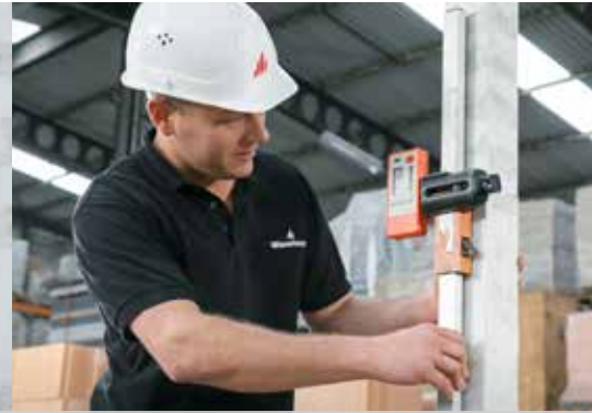
2. De vloerpas uitzetten