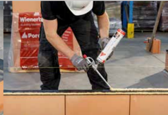
12. Twee stroken Dryfix extra aanbrengen op de waterkering