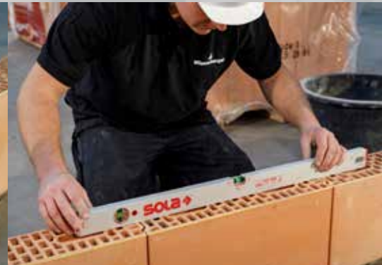
7. De vlakheid in langsrichting over 3 stenen controleren (lengte waterpas \geq 80 cm)