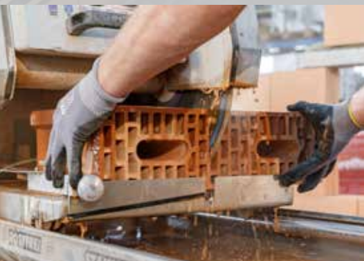
18. De stenen verzagen met de tafelzaag

* Bij muurbreedte 10 cm 1 strook aanbrengen in het midden van de steen